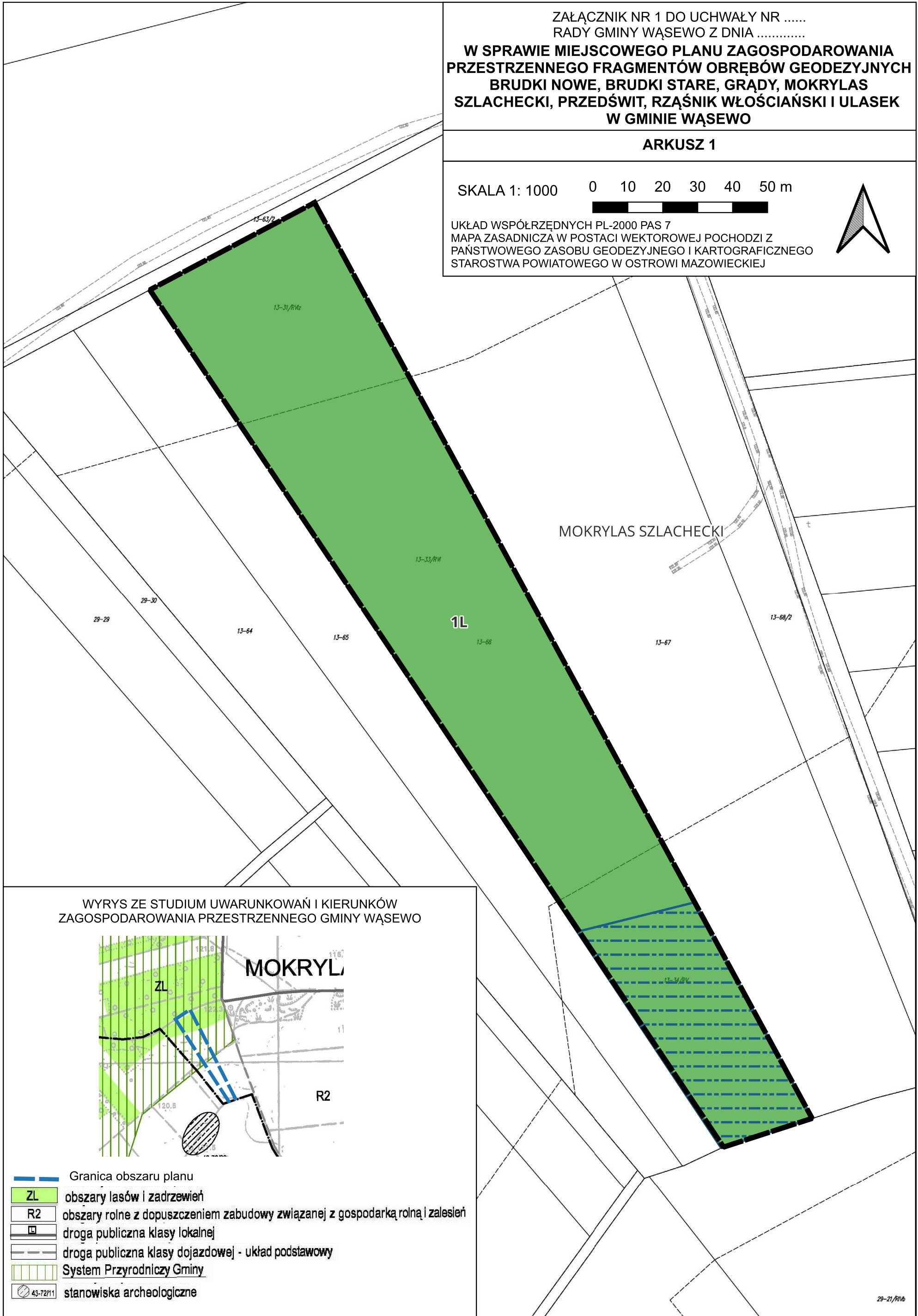
WYRYS ZE STUDIUM UWARUNKOWAŃ I KIERUNKÓW ZAGOSPODAROWANIA PRZESTRZENNEGO GMINY WĄSEWO